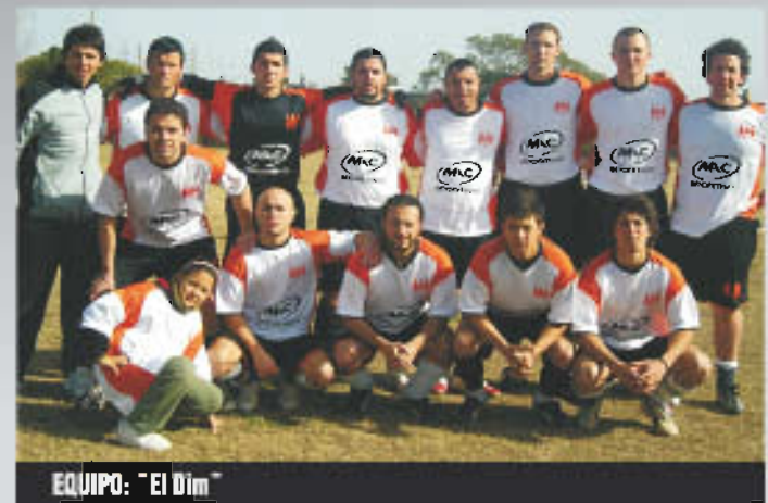
EQUIPO: "El Dim"