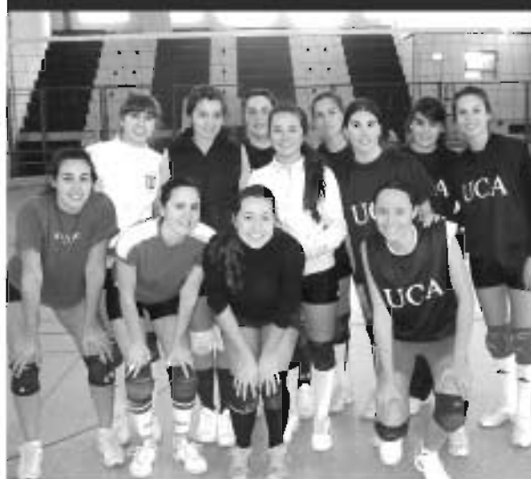
El equipo de voleibol de la UCA, junto al de la UNER.