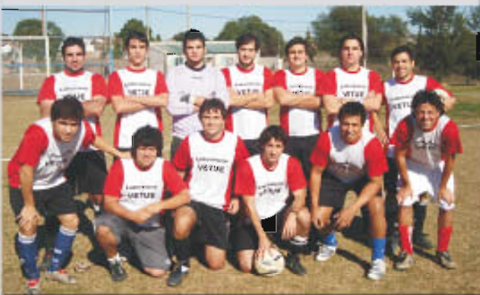
EQUIPO: "Pan y Circo"