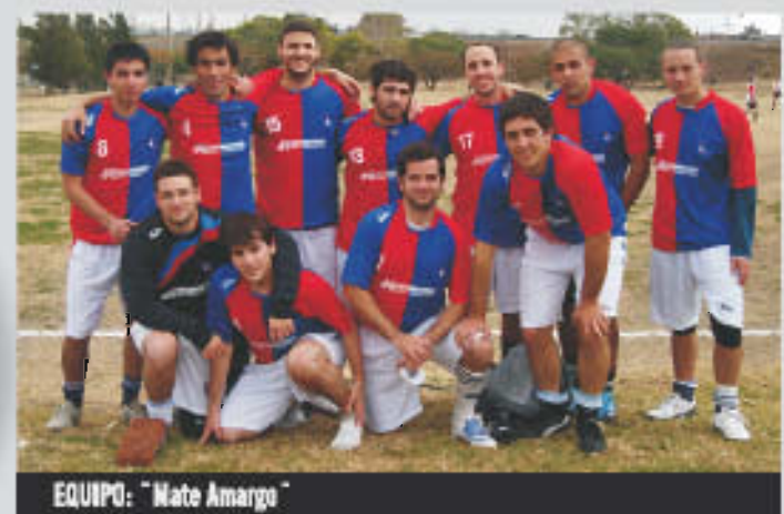
EQUIPO: "Mate Amargo"