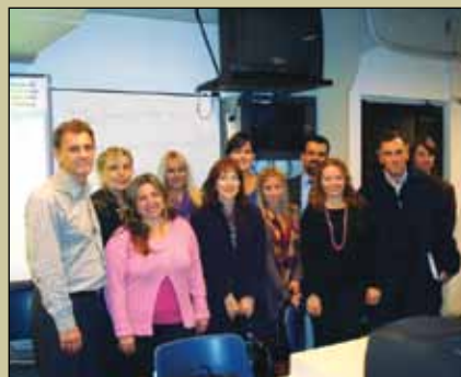
Profesores de las cuatro ediciones del taller durante las clases presenciales.

Las tres primeras ediciones del taller fueron dictadas para el claustro de la Facultad de Psicología y Educación, mientras que la cuarta estuvo dedicada a los profesores de las unidades académicas de la Sede de la Universidad en la ciudad de Paraná. Como resultado de ello, se capacitaron un total de 46 profesores, muchos de los cuales ya han implementado sus respectivos blogs de cátedra. Para 2010, se prevé repetir la experiencia incorporando a profesores de otras Facultades e Institutos. Los relatos de varias experiencias concretas de aplicación, formulados por los propios do-