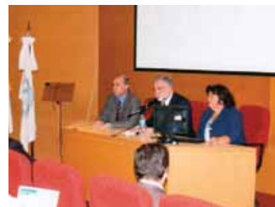
El libro colectivo fue realizado por docentes investigadores de la Sede Rosario.

Al finalizar la presentación, el público asistente interesado en el tema intercambió opiniones y aclaró inquietudes con los autores de la obra.