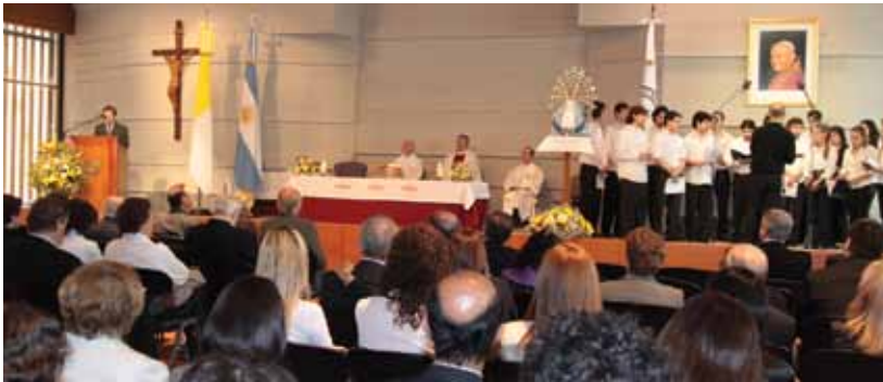
La celebración tuvo un importante marco institucional y un clima de camaradería.