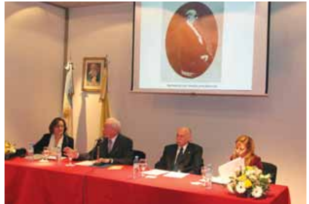
Las jornadas sobre Sarmiento resaltaron el valor de la obra del prócer.