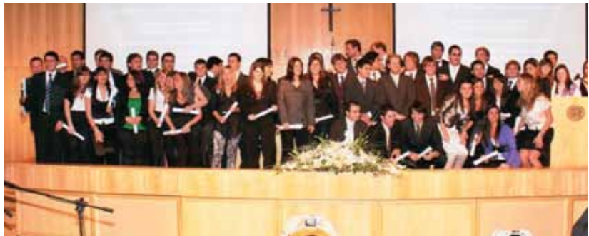
Egresaron contadores, administradores y magísteres en administración y dirección de empresas.