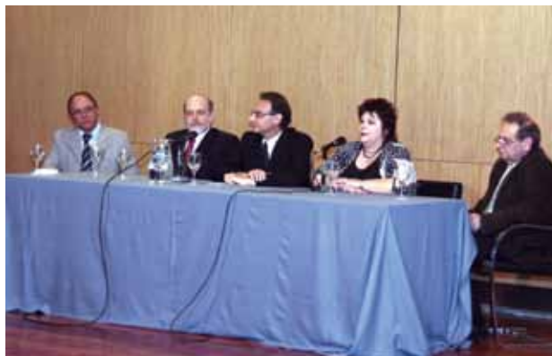
Los expositores resaltaron los proyectos de la UCA en la especialidad.

El Auditorio Santa Cecilia de la Universidad fue sede de la 2ª Jornada de Intercambio sobre el Escenario Energético Argentino: "Los biocombustibles", organizada por el Grupo de Biocombustibles de la Facultad de Ciencias Fisicomatemáticas e Ingeniería, con la adhesión de la Asociación Nacional de Estudiantes de Ingeniería Industrial. Expusieron conocidos especialistas, quienes tuvieron en cuenta la entrada en vigencia el próximo 1º de enero de la Ley 29093, que establece que los combustibles Diesel y las naftas comercializadas en el país deberán ser mezcladas desde ese momento con Biodiesel y Bioetanol, respectivamente.