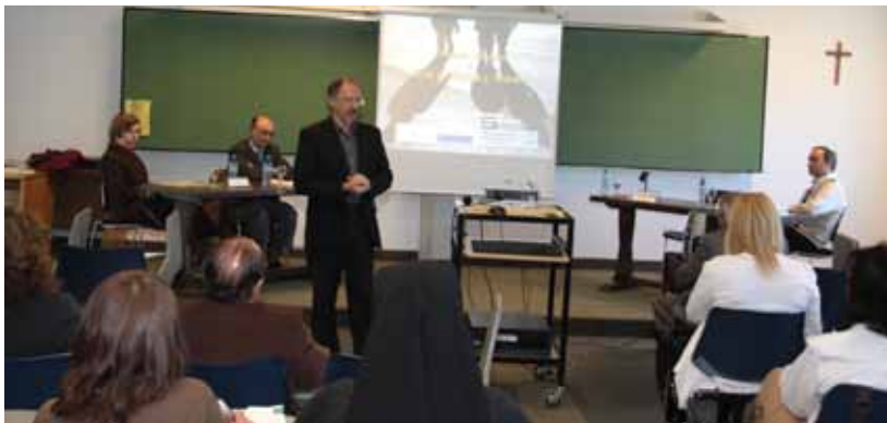
La violencia fue el eje de la tercera reunión de la serie.