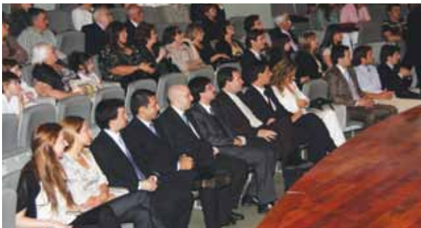
Treinta abogados egresaron del posgrado Especialización en Derecho del Trabajo.

El 4 de noviembre pasado tuvo lugar en el Auditorio Santa Cecilia la entrega de diplomas y medallas a los egresados de la carrera de posgrado Especialización en Derecho del Trabajo, que se dicta en la Facultad de Derecho de la UCA merced a un convenio entre la Asociación Argentina de Derecho del Trabajo y de la Seguridad Social y la Universidad