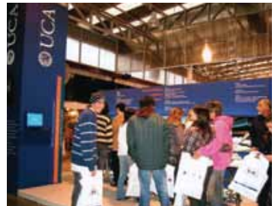
Participaron unidas las tres Facultades de la UCA del Campus Rosario.

Como es habitual, gran cantidad de estudiantes del nivel secundario provenientes de la ciudad y sus alrededores se acercaron al stand de la UCA a reci-