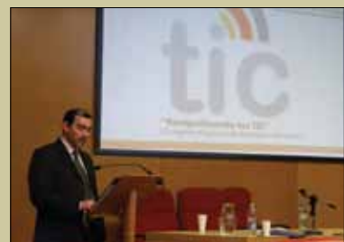
Los expositores abordaron diversos ejes de interés profesional y público.

El encuentro fue decretado de interés provincial y municipal, y los organizadores estiman que su finalidad fue alcanzada con creces, ya