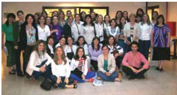
Casi 50 educadores asistieron al encuentro presencial del curso sobre sexualidad.

Del 30 al 31 de octubre pasado, se impartió el encuentro presencial del Curso a Distancia de Capacitación Docente “Educación integral de la