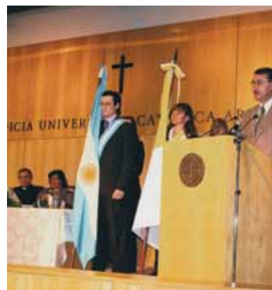
Organizaron el acto la Secretaría Académica y los Departamentos de Alumnos y Profesores.