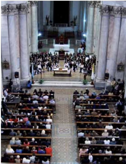
Recibieron sus diplomas los egresados de las tres unidades de Paraná.

Se realizó en Paraná la Colación de Grados de la Facultad de Humanidades “Teresa de Ávila” y de las Subsedes de la Facultad de Derecho y del Instituto de Ciencias Políticas y Relaciones Internacionales. En el acto, se conmemoró el 40º Aniversario de la incorporación del Instituto “Teresa de Ávila” a la UCA, hito fundacional de la Sede Paraná.