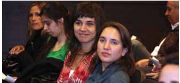
Al Acto de Cierre, asistieron autoridades de la Facultad y representantes de las empresas participantes.

Del 1° al 3 de septiembre, se realizó el Encuentro Universidad-Empresa 2009, organizado por la Facultad de Ciencias Sociales y Económicas de la Universidad. En esta nueva edición de la iniciativa, participaron más de 50 empresas que dieron charlas sobre temas de inserción laboral y desarrollo profesional, además de participar en la tradicional exposición con stands donde