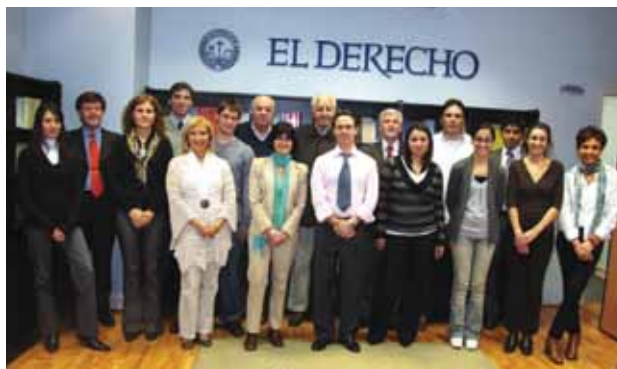
Las áreas de trabajo abarcan: administración, producción, redacción, sistemas, atención al cliente, ventas y compras.