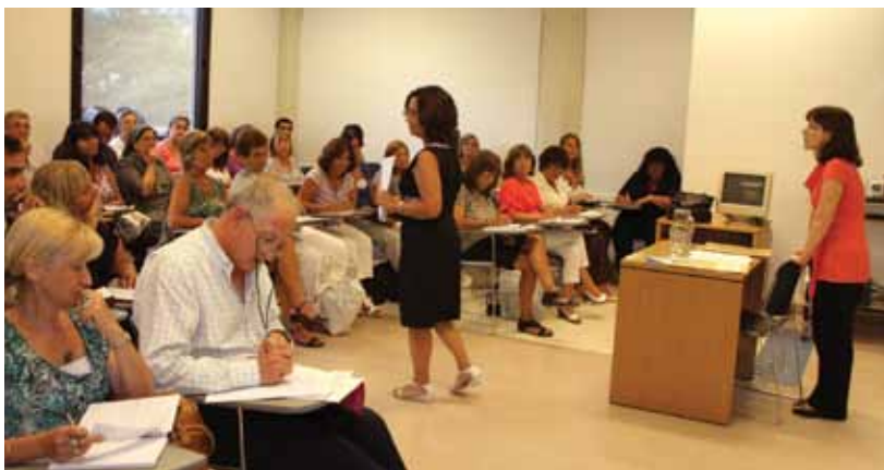
En tres jornadas, varios expertos trataron seis temas que preocupan a las escuelas.