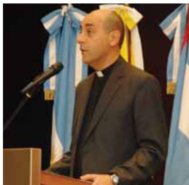
El Pbro. Fernández valoró la identidad local.

El 9 de marzo último, se inauguró el flamante edificio de la Sede Paraná de la Pontificia Universidad Católica Argentina (UCA). El acontecimiento marcó el comienzo de una nueva etapa en la vida institucional de la casa de altos estudios, signada asimismo por su reorganización académica y la elección de sus nuevas autoridades, y fue celebrado con una importante ceremonia presidida por el Rector, Pbro. Dr. Víctor Manuel Fernández, en la que asumieron sus cargos los nuevos Decano, Secretario y Directores de Departamento de la Facultad Teresa de Ávila. El Rector destacó en su discurso el inicio del nuevo ciclo, que recogía la tarea realizada hasta el momento y daba un paso adelante en el afianzamiento del desarrollo futuro de la Sede Paraná, alentando a sus integrantes a construir a partir de su identidad local su propio proyec-