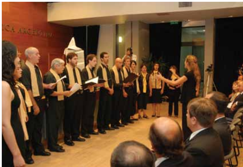
El Coro Carmina Gaudii, de Paraná, tuvo a su cargo el cierre del acto inaugural.

Para finalizar la celebración, el Coro Carmina Gaudii, perteneciente a la Sede Paraná de la Pontificia Univer-