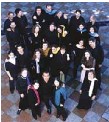
El Grupo de Canto Coral, creado en 1973.

La Facultad de Artes y Ciencias Musicales de la UCA presenta su Ciclo de Conciertos Gratuitos 2010, a realizarse entre abril y noviembre, los últimos lunes de cada mes a las 18 horas, en la Iglesia Santa Catalina de Siena (San