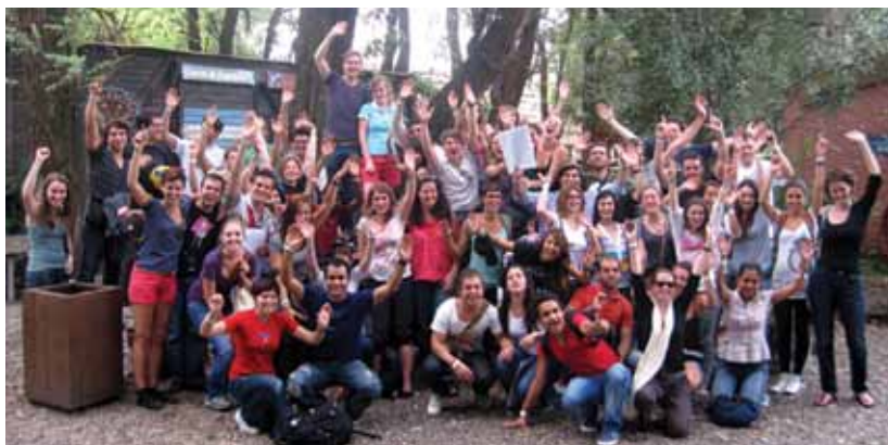
Algunos de los 150 estudiantes de intercambio que cursarán este semestre en la UCA.

El segundo día de esta Semana de Orientación e Inscripción diagramada especialmente para ellos, los alumnos extranjeros conocieron un poco de la vida cotidiana en Buenos Aires y, al mediodía, disfrutaron de un asado organizado en el predio de la Facultad de Ciencias Agrarias. El miércoles, la mayoría de los estudiantes ya intentaba hablar en español y antes de aprender a bailar el tango recibieron informa-