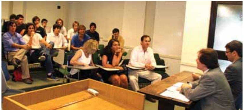
El Director de la carrera invitó a profundizar el intercambio de ideas y acciones.