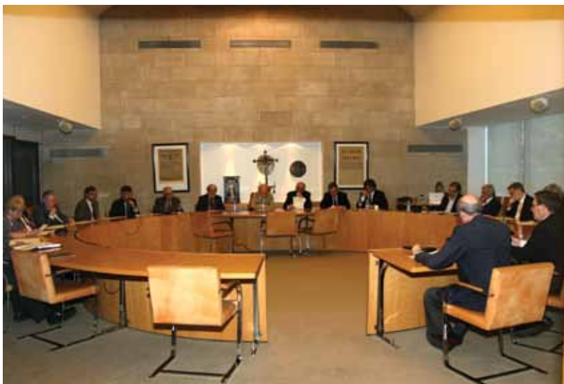
La Mesa de Diálogo y Trabajo para la Reforma de la Ley del Consejo de la Magistratura celebró su reunión plenaria en la UCA.