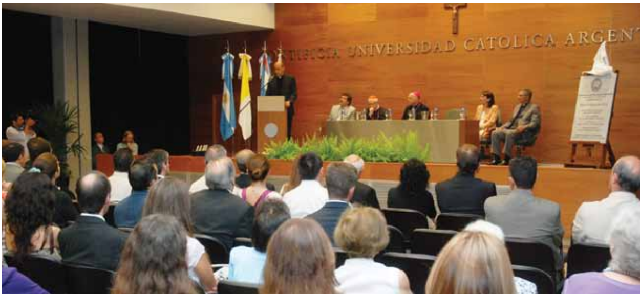
Casi medio centenar de personas colmó el flamante auditorio, donde se desarrolló el acto principal.