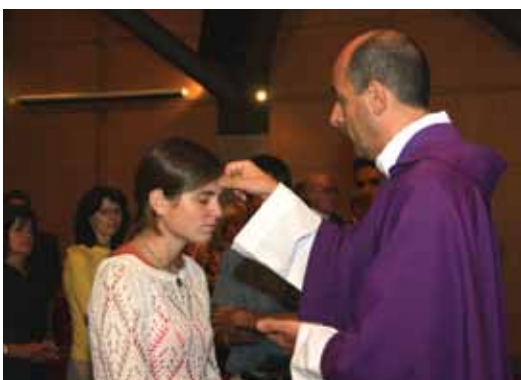
Imposición de las Cenizas: una bendición para el cambio y la renovación.