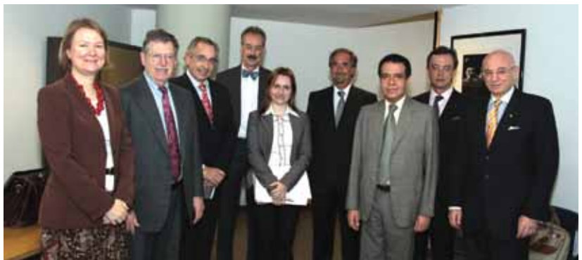
Destacados expertos trataron la política fiscal internacional y las modificaciones de la OCDE.

en aspectos de política fiscal a nivel internacional, con especial énfasis en las recientes modificaciones introducidas por la Organización para la Cooperación y el Desarrollo Económico (OCDE). También se profundizó sobre medidas correctivas contra el uso y abuso de tratados de doble imposición, donde se hizo referencia a los aportes derivados de reciente jurisprudencia dictada en el ámbito internacional. Asimismo, se contempló la presencia de un panel especializado para tratar