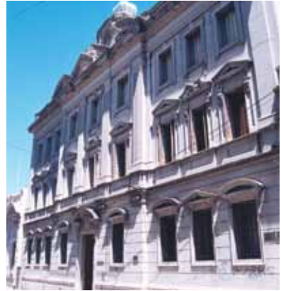
La Facultad de Humanidades fue sede de los talleres de orientación laboral.

alumnos del último año y a las tesis de las carreras Licenciatura en Psicología y Licenciatura en Psicopedagogía, dictadas ambas en nuestra Facultad de Humanidades "Teresa de Ávila".