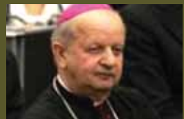
Card. Stanislaw Dziwisz.

El ex secretario privado del Papa Juan Pablo II recibirá el Doctorado Honoris Causa de la Pontificia Universidad Católica Argentina.