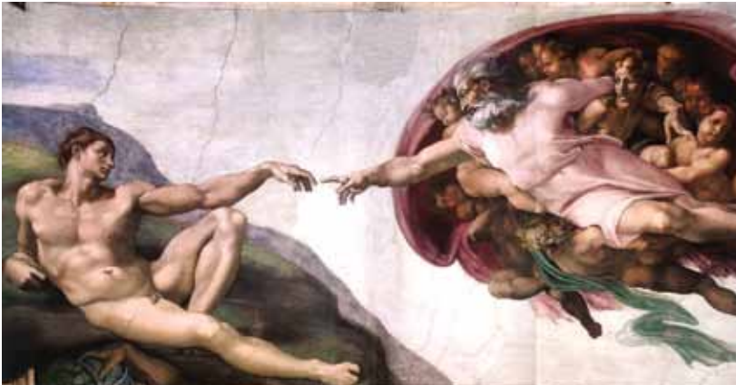
Fragmento de "La creación de Adán", fresco de Miguel Ángel en la Capilla Sixtina.

El Instituto de Cultura y Extensión Universitaria de la UCA (ICEU) convoca al curso "El hombre: ¿Enigma, misterio, destino?", que se desarrollará los jueves 5, 12, 19 y 26 de noviembre, de