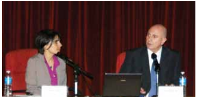
Numerosas personalidades de la ciudad y su zona de influencia asistieron a la presentación del informe sobre la Deuda Social en el Campus Rosario.

El Departamento de Investigación Institucional de la UCA presentó en el Campus Rosario el Barómetro de la Deuda Social Argentina: "La Deuda Social Argentina 2004-2008. El desarrollo humano y social en la Argentina en los umbrales del Bicentenario". El acto se realizó el pasado 3 de septiembre y en su transcurso, además, se difundió el informe elaborado conjuntamente con la Fundación Arcor "Barómetro de la Deuda Social de la Infancia. Argentina 2004-2008: Condiciones de vida de la niñez y adolescencia."