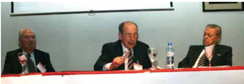
El evento reunió a cirujanos de todo el país.