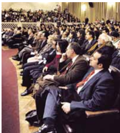
Asistieron al encuentro en Santa Fe 14 profesores y 45 alumnos de la UCA.

Un total de 14 profesores y 45 alumnos del Instituto de Ciencias Políticas y Relaciones Internacionales de nuestra Universidad (ICPRI), acompañados por sus autoridades, participaron del IX Congreso Nacional de Ciencia Política. El encuentro se desarrolló en torno a la temática "Centros y periferias: equilibrios y asimetrías en las relaciones de poder" y se llevó a cabo en la ciudad de Santa Fe, del 19 al 22 de agosto último.