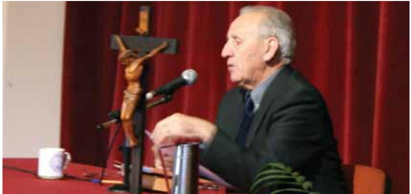
El teólogo González de Cardedal diserta en la Facultad de Teología.

Del 21 al 23 de septiembre, se desarrolló en la Facultad de Teología de la UCA la XXVIII Semana de Teología de la Sociedad Argentina de Teología, presidida por el Decano de dicha unidad académica, Pbro. Dr. Víctor Manuel Fernández. El tema convocante fue “El diálogo de la Teología con la cultura en Argentina y el compromiso en la vida pública. Nuevos horizontes.”. El encuentro contó con la visita del insigne teólogo español Olegario González de Cardedal, quien es doctor en Teología por la Universidad de Munich y cursó estudios de Filosofía e Historia en la Universidad de Oxford y en la Universidad Católica de Washington. También es Catedrático de la Universidad Pontificia de Salamanca, fue miembro de la Comisión Teológica Internacional (1969-1979), es Académico Numerario de la Real Academia de Ciencias Morales y Políticas de Madrid, autor de numerosas obras de alto rigor teológico y colaborador en los principales periódicos de España.