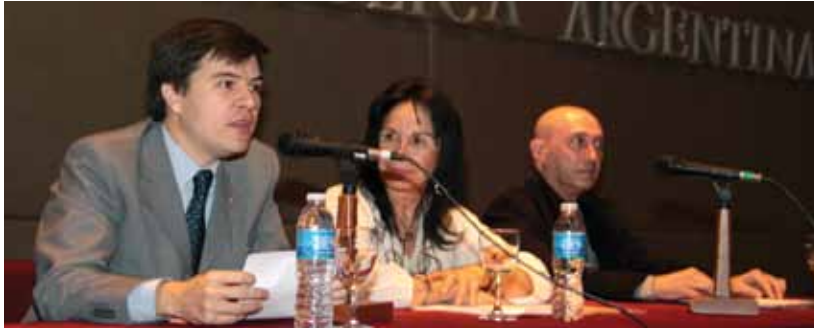
El Secretario Académico de la UCA habla en la apertura del encuentro de la AACC.