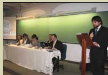
La Jornada del Centro de Estudiantes de Educación se concentró en la transformación educativa.