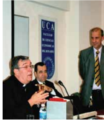
El Rector habla a docentes y autoridades en Rosario.