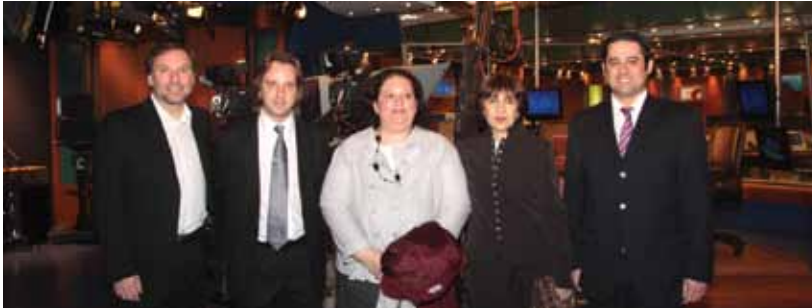
Autoridades del ICOS junto a directivos de TELEFE, en el canal.

El Instituto de Comunicación Social, Periodismo y Publicidad de nuestra Universidad (ICOS) firmó un convenio con TELEFE que tiene por objeto establecer pautas generales para promover mecanismos de colaboración entre la cátedra Marketing de Espectáculos, de la carrera Comunicación Publicitaria e Institucional, y dicha emisora. Las actividades a desarrollar en forma conjun-