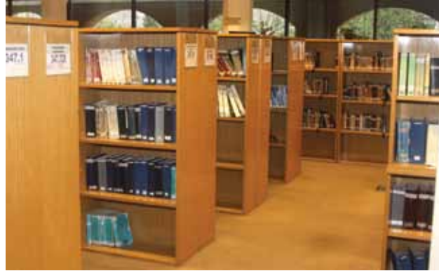
La Biblioteca Central de la UCA se prepara para obtener la ISO 9001 y es guía y formadora del Sistema de Bibliotecas de toda la Universidad.

inauguración, ya se había comenzado a trabajar en la integración de los fondos documentales y servicios pertenecientes a cada unidad de información. Establecer los criterios comunes en tareas que se desarrollaban con cierta independencia en cada biblioteca, normalizando los procesos, garantizó, luego de la centralización, la rápida adaptación a una nueva estructura naturalmente más compleja.