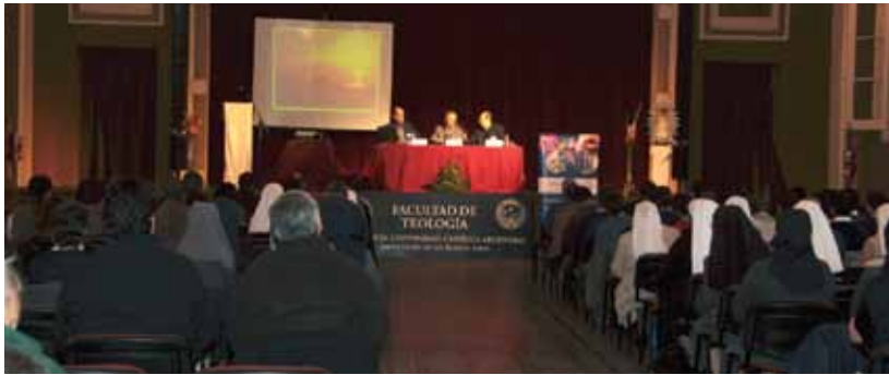
Numerosos seminaristas de Buenos Aires y diferentes provincias del país asistieron al curso.