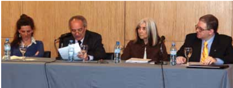
El Decano de Filosofía y Letras inaugura el Cuarto Coloquio Internacional de Literatura Comparada.

Organizado por el Centro de Estudios de Literatura Comparada “María Teresa Maiorana” del Departamento de Letras de la Facultad de Filosofía y Letras de la UCA, se celebró los días 2, 3 y 4 de septiembre el Cuarto Coloquio Internacional de Literatura Comparada. En esta edición, estuvo dedicado al tema “Borges-Francia”, respondiendo a la celebración de los ciento diez años del nacimiento del gran escritor argentino Jorge Luis Borges, y a la conveniencia de reflexionar acerca de las fecundas y con todo conflictivas deudas que reconocen tanto Borges respecto de las letras francesas como éstas respecto de la obra del escritor. Su influencia ha sido notable en el pensamiento de autores galos de la segunda mitad del siglo XX, como Foucault, Derrida, Genette y Deleuze.